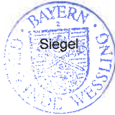
Michael Sturm Erster Bürgermeister